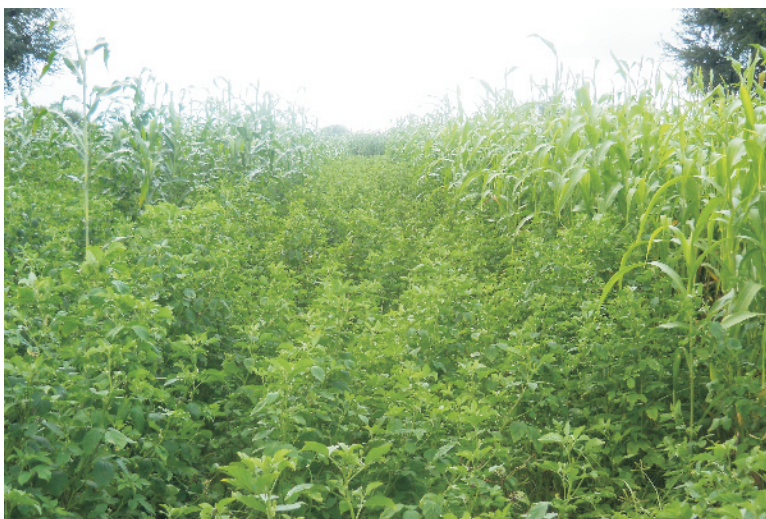
चित्र 1 ज्वार की ग्वार के साथ बुवाई

फसल-चक्र: चारे के लिए बोई गई खरीफ ज्वार के बाद, बरसीम, रिजका, जई, गेहूँ, जौ इत्यादि फसलों को बोया जा सकता है। ज्वार को अधिक नत्रजन की आवश्यकता होती है, इसलिए इसके बाद दलहन फसल को उगाना चाहिए जिससे भूमि की उर्वरता बनी रहे। ज्वार को चारे वाली फसल के साथ मिश्रित फसल के रूप में भी बोया जा सकता है (चित्र 1)। चंवला, मूँग, ग्वार या मोठ को ज्वार के साथ बुवाई करने से चारे की पौष्टिकता में वृद्धि होती है।