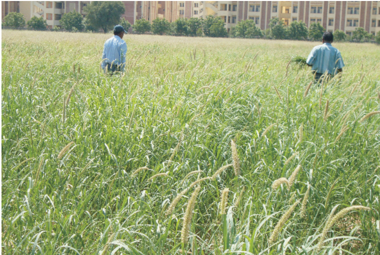
चित्र 12 काजरी-75 अंजन घास की एक किस्म

किस्में: किस्मों का चयन जलवायु तथा भूमि व चारे की माँग के अनुसार करें। अंजन घास की काजरी 75 (मारवार अंजन, चित्र 12), काजरी अंजन-358 (चित्र 13), काजरी अंजन-2178 व जिनोटाइप काजरी-2221 उन्नत किस्में/जिनोटाइप्स भाकृअनुप-केन्द्रीय शुष्क क्षेत्र अनुसंधान संस्थान, जोधपुर द्वारा विकसित की गई हैं जो शुष्क क्षेत्रों के लिए उपयुक्त हैं। इसके अलावा आईजीएफआरआई-3108, आईजीएफआरआई-727 अन्य किस्में हैं। इस घास की अनुशांसित (रिलीज्ड) किस्में कम हैं।