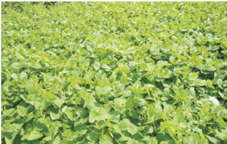
चित्र 3 चारे के लिए लोबिया

खेत की तैयारी: खेत की दो या तीन बार कल्टीवेटर, देशी हल या हेरो से जुताई करें तथा पाटा लगाकर समतल कर लें। यदि खेत में खरपतवार या पिछली फसल के अवशेष हों तो उन्हें अच्छी तरह से जुताई करके खेत में दबा देना चाहिए।