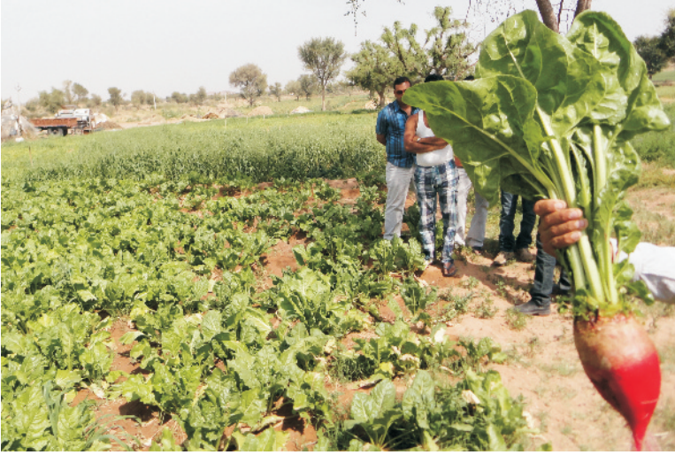
चित्र 8 चारा चुकन्दर की खेती

उन्नत किस्में: बाजार में उपलब्ध संकर किस्में – जेके कुबेर, मोनरो, जोना, जामोन, स्पलेंडिड ।