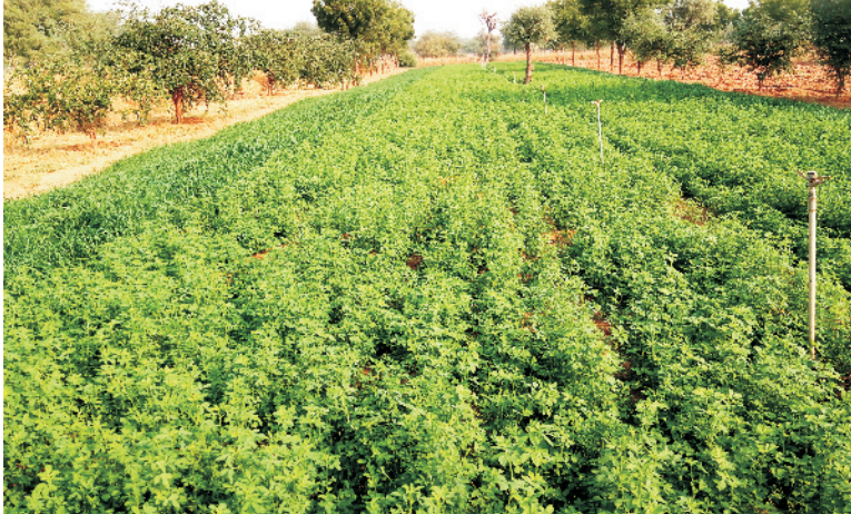
चित्र 6 फव्वारा विधि द्वारा सिंचाई से रिजके की खेती

सिंचाई प्रबंधन: गहरी एवं विकसित जड़ों वाली फसल होने के कारण रिजका असिंचित क्षेत्रों में नमी की खोज में अपनी जड़ों का विकास 3 मीटर की गहराई तक कर सकती है। शुष्क स्थानों पर रिजका को सिंचाई की सुविधानुसार ही उगाते हैं। इसको प्रति वर्ष 6–8 सिंचाईयों की आवश्यकता होती है। भारी मिट्टी में इसे प्रारम्भिक अवस्था में 1–2 सिंचाई की जरूरत होती है। भूमि में नमी की कमी होने पर प्रत्येक कटाई के बाद सिंचाई अवश्य करें। वर्षा ऋतु में पौधे सुषुप्तावस्था में पहुँच जाते हैं, इसलिए इस समय उचित जल निकास का प्रबंध होना चाहिए। कम पानी की उपलब्धता में फव्वारा विधि द्वारा सिंचाई करके रिजके की खेती की जा सकती है (चित्र 6)।