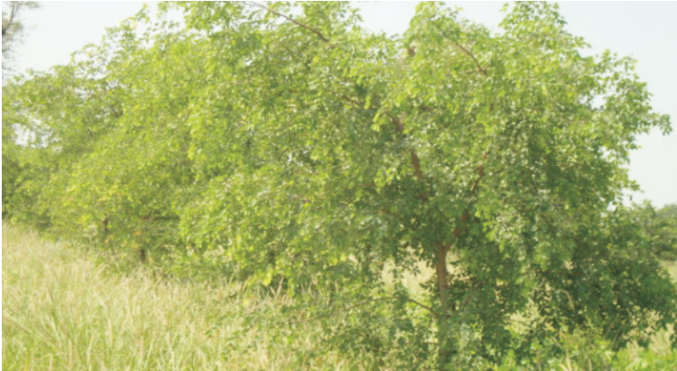
चित्र 10 द्विस्तरीय वन चरागाह पद्धति

2. द्विस्तरीय वन-चरागाह पद्धति में असमान ऊँचाई तक बढ़ने वाली चारा फसलों एवं वृक्षों/झाड़ियों की रोपाई एक साथ एक ही भूमि पर करते हैं। भूमि की सतह पर चारा फसलों के रूप में धामण, सेवण, कुरा घास, ग्रामणा तथा दलहनी चारा फसलों को चारा वृक्षों के बीच में उगाया जाता है (चित्र 10)। इस पद्धति में चारे वाली फसलें भूमि की सतह से कुछ ऊँचाई तक बढ़ती है तथा चारा वृक्ष ज्यादा ऊँचाई तक बढ़ते हैं।