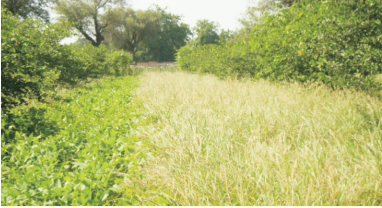
चित्र 11 त्रिस्तरीय वन-चरागाह पद्धति