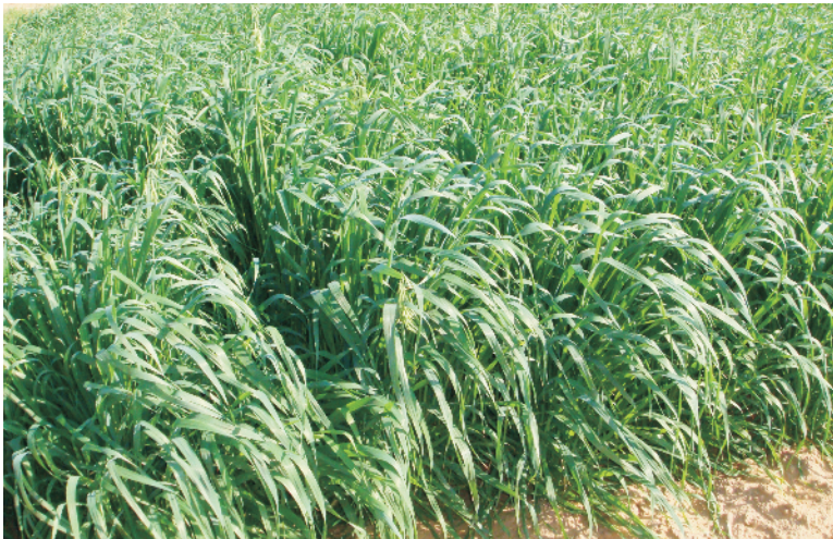
चित्र 7 जई की उन्नत खेती

बीज एवं बुवाई: खेत को अच्छी तरह से तैयार करके मध्य अक्टूबर से मध्य नवम्बर के समय बुवाई करनी चाहिए। इसकी बुवाई बीज छिड़क कर अथवा पंक्तियों में की जा सकती है। बुवाई के लिये प्रति हेक्टेयर लगभग 70-100 कि.ग्रा. बीज की आवश्यकता होती है। बीज को 20-25 से.मी. की दूरी पर बनी कतारों में 4-5 से.मी. की गहराई पर बोना चाहिए। बुवाई से पूर्व बीज को 2 ग्राम मेन्कोजेब नामक फफूंदी नाशक दवा प्रति कि.ग्रा. बीज की दर से उपचारित कर लेना चाहिए।