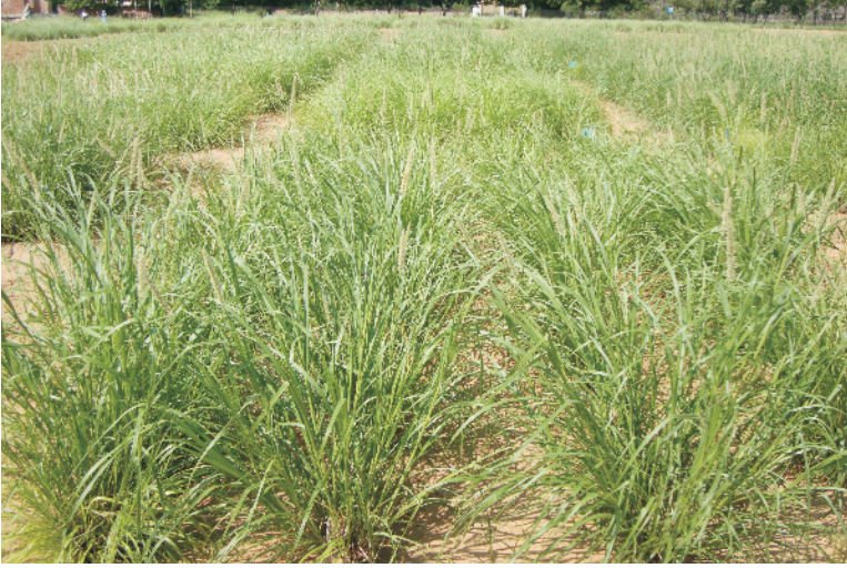
चित्र 14 अंजन घास की पंक्तियों में बुवाई

बुवाई का समय, बोनो की विधि, भूमि की दशा, जलवायु इत्यादि के अनुसार बीज दर 3–12 कि.ग्रा. प्रति हेक्टेयर होती है। औसत 5–6 कि.ग्रा. बीज प्रति हेक्टेयर काम में लेते हैं। बुवाई के समय बीज व खेत की नम मिट्टी (1:5 आयतन से) मिलाकर मिश्रण बनायें। तैयार खेत में 75 से.मी. दूरी पर कल्टीवेटर से उथले उमरे बनायें। तैयार मिश्रण को इन उमरों में बोते हैं। बुवाई के उपरान्त उमरों में झाड़ी, नीम या बबूल इत्यादी की टहनी, बीज को ढकने के लिए चलाते हैं। बुवाई हमेशा उथली करें क्योंकि अंजन घास का दाना (केरिऑपसिस) छोटा होता है व बीजों पर मिट्टी ज्यादा आने पर अंकुरण प्रभावित होता है। बीज को 16–18 घंटे पानी में गीला करके (हाइड्रेशन) छाया में सुखाकर बोया जाता है। 0.25 प्रतिशत थिराम का प्रयोग बीजों के अंकुरण के लिए लाभप्रद पाया गया है। बुवाई के तुरन्त बाद यदि वर्षा हो जाए तो चरागाह अच्छा स्थापित होता है।