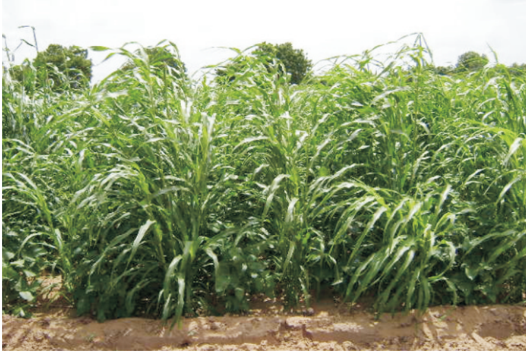
चित्र 2 बाजरा के साथ चंवला का अन्तराशस्य

फसल-चक्र: बाजरे की फसल प्रति वर्ष एक ही खेत में लगातार उगाने से उपज कम हो जाती है। इसलिए प्रत्येक दूसरे वर्ष फलीदार फसलें जैसे ग्वार, चंवला, मूंग, मोठ आदि बोने से भूमि की उर्वरा शक्ति बढ़ती है और अगले वर्ष बाजरे की उपज में भी वृद्धि होती है (चित्र 2)। फलीदार फसलों को बाजरा के साथ अन्तराशस्य के रूप में उगाने से चारे की गुणवत्ता में वृद्धि की जा सकती है। इसके लिए दो पंक्तियों में बाजरा और दो कतारों में फलीदार फसल बोना चाहिए।