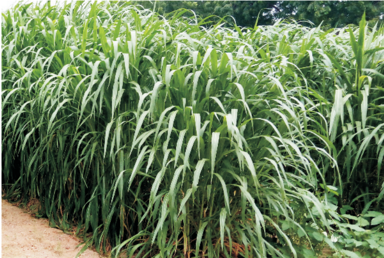
चित्र 5 चारे के लिए नेपियर बाजरा हाइब्रिड

उन्नत किस्में: सीओ-1, सीओ-2, सीओ-3, सीओ-4, पूसा जायंट, एनबी -21, आईजीएफआरआई-5 आदि मुख्य किस्में हैं।