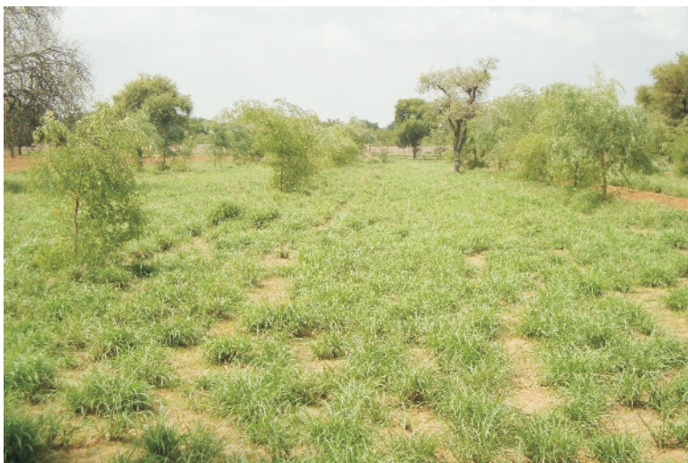
चित्र 15 वर्षा के दो सप्ताह बाद अंजन घास की बढ़वार

दिन की कटाई से अन्य कटाइयों से ज्यादा मिला। द्वितीय वर्ष 30 दिन की कटाई से 45 दिन की कटाई के बराबर व 60 दिन की कटाई से अधिक हरा चारा मिला जबकि प्रोटीन की मात्रा 30 दिन की कटाई पर अधिक पाई गयी (सारणी 9)। स्थापना वर्ष (2004) में घास की बुवाई के बाद कम वर्षा (150 मि.मी.) हुई, जबकि दूसरे वर्ष (2005) में जुलाई एवं अगस्त महीनों में अच्छी वर्षा (210 मि.मी.) होने से पौधों की वृद्धि अच्छी हुई जिससे द्वितीय वर्ष चारे की पैदावार अधिक मिली। वर्षा के सामान्य होने पर व उचित वितरण की स्थिति में बढ़वार शुरू होने के 30 दिन बाद चारे कटाई करने पर अधिक व उच्च गुणवत्ता का चारा मिलता है।