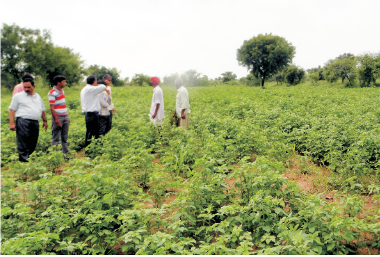
चित्र 4 किसान के खेत पर ग्वार की खेती का प्रदर्शन

जलवायु एवं भूमि: ग्वार ऊष्ण कटिबन्धीय शुष्क एवं अर्धशुष्क क्षेत्रों की एक महत्वपूर्ण फसल है। अच्छी वृद्धि के लिए 30–35° सेल्सियस तापमान अच्छा रहता है। पानी की अधिकता व खेत में पानी रूकने की स्थिति में ग्वार के पौधे मर जाते हैं। ग्वार की अच्छी वृद्धि के लिए 400 से 500 मि.मी. वर्षा होना आवश्यक है। वर्षा कम होने पर फसल उत्पादन कम होता है। इसकी खेती के लिए बलुई-दोमट मिट्टी अच्छी रहती है। ग्वार की फसल लवणता के प्रति संवेदनशील होती है।