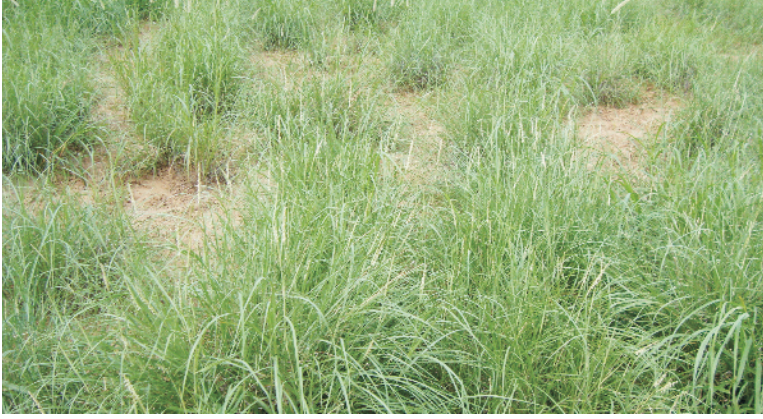
चित्र 9 एक स्तरीय वन चरागाह पद्धति

2. द्विस्तरीय वन-चरागाह पद्धति में असमान ऊँचाई तक बढ़ने वाली चारा फसलों एवं वृक्षों/झाड़ियों की रोपाई एक साथ एक ही भूमि पर करते हैं। भूमि की सतह पर चारा फसलों के रूप में धामण, सेवण, कुरा घास, ग्रामणा तथा दलहनी चारा फसलों को चारा वृक्षों के बीच में उगाया जाता है (चित्र 10)। इस पद्धति में चारे वाली फसलें भूमि की सतह से कुछ ऊँचाई तक बढ़ती है तथा चारा वृक्ष ज्यादा ऊँचाई तक बढ़ते हैं।