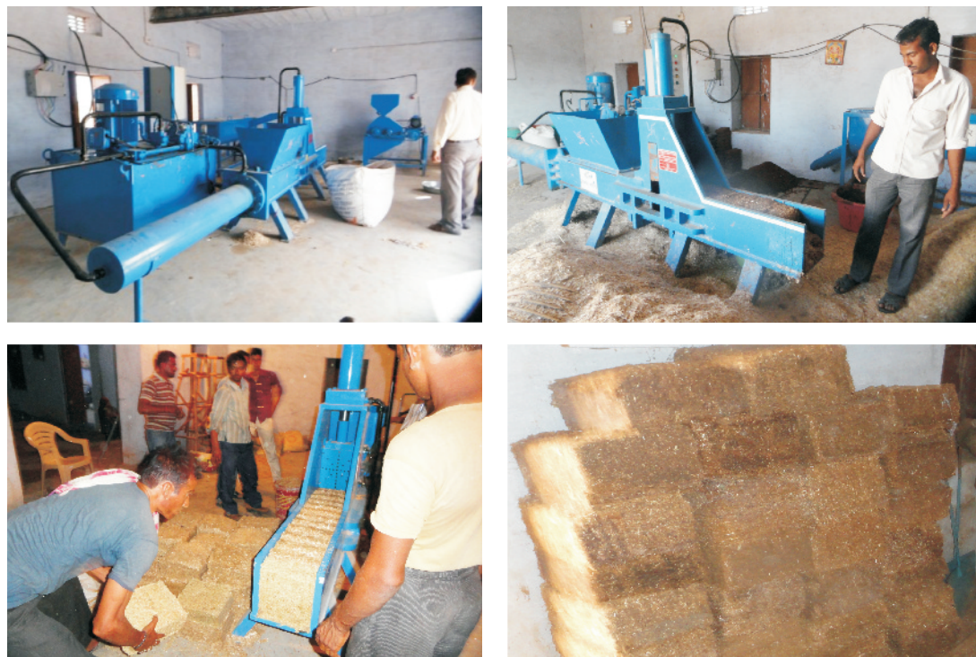
चित्र 16 नागौर जिले के हरसोलाव गांव में स्थापित सम्पूर्ण पशु आहार बट्टिका बनाने की मशीनें