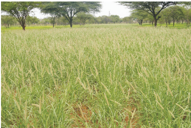
चित्र 13 अंजन घास काजरी अंजन-358

बुवाई का समय व विधि: अंजन घास की बुवाई जुलाई से अगस्त के प्रथम सप्ताह तक की जा सकती है। जहाँ सिंचाई की सुविधा है वहाँ फरवरी-मार्च में भी बुवाई की जा सकती है। वर्षा ऋतु में, वर्षा होने पर ही बुवाई करें। यद्यपि तैयार खेत में सूखे में ही बुवाई की जा सकती है, परन्तु वर्षा देर से होने पर चींटियाँ, आंधियाँ इत्यादि बीज को नुकसान पहुँचा सकते हैं। चरागाह को बीज द्वारा, पौध द्वारा, जड़ों द्वारा व बीजों की गोलियाँ बनाकर लगाया जा सकता है।