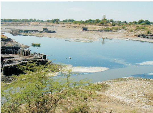
शहरी वाहित मल जल

इस वाहित मल को परिष्कृत करने के उपरांत बाग-बगीचों में इसका उपयोग करना चाहिए। जहाँ तक हो सके वाहित मल से सिंचित मृदाओं में पत्तेदार सब्जियों को नहीं उगाना चाहिए। परिष्कृत वाहित मल में पोषक तत्वों की उपलब्धता के कारण इसका उपयोग फसल उत्पादन में किया जा सकता है।