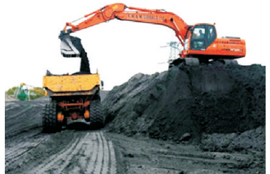
औद्योगिक इकाइयों से निकली फ्लाइंग तथा उसका भंडारण