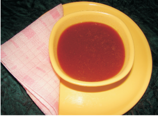
टमाटर की चटनी

एक किलो कटे हुए टमाटरों में पिसे हुए प्याज 100 ग्राम, अदरक 50 ग्राम, लहसुन 20 ग्राम मिलाकर पकायें। गरम होने पर 750 ग्राम चीनी मिलायें व पकाते रहें। चाशनी गाढ़ी होने पर पिसी लाल मिर्च 15 ग्राम व गरम मसाला 10 ग्राम मिलायें। गाढ़ी होने पर नमक मिलाकर नीचे उतारें व सोडियम बेंजोएट एक ग्राम प्रति किलो टमाटर की दर से अलग से घोल बनाकर मिलायें व बोतलों में भर दें।