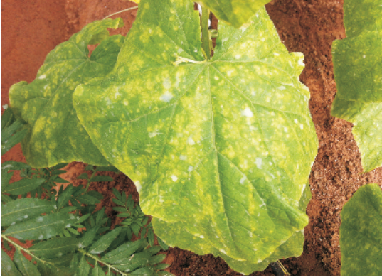
चूर्णिल आसिता रोग ग्रसित पत्ती

पर सफेद या धुंधले धूसर धब्बों के रूप में दिखाई देता है तत्पश्चात ये धब्बे चूर्णयुक्त हो जाते हैं। ये सफेद चूर्णिल पदार्थ अन्त में समूचे पौधे की सतह को ढँक लेते हैं। जिसके कारण फलों का आकार छोटा हो जाता है तथा बीमारी की गंभीर स्थिति में पौधों के पत्ते भी गिर जाते हैं।