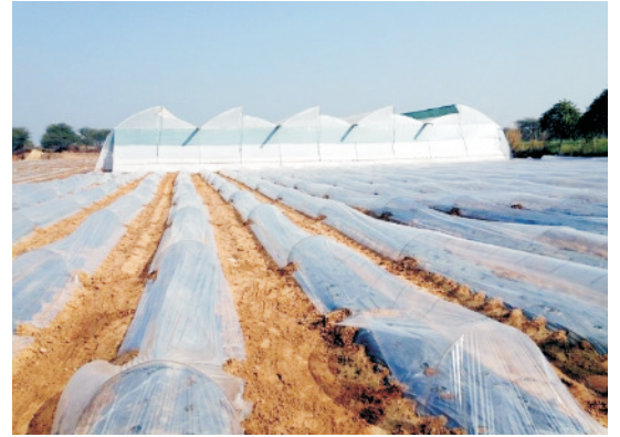
लो-टनेल में सब्जी उत्पादन

प्लास्टिक लो-टनेल या रो-कवर पारदर्शी पॉलीथिन (30 माइक्रोन) की एक ऐसी संरचना होती है जो सर्दी के दिनों में नाली/पंक्ति या बेड में बोये या रोपित पौधों को लोहे या लकड़ी के अर्ध-चंद्राकार खांचे या हुक्स पर ढंके होती हैं। बाहर की अपेक्षा लो-टनेल के अंदर का वातावरण अधिक गर्म रहता है जिसके कारण पौधे आसानी से विकास करते रहते हैं।