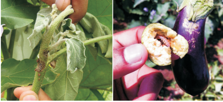
बैंगन के पौधे पर तना व फल छेदक कीट का प्रकोप

सफेदमक्खी, थिप्स हरा तेला व मोयला: ये कीट पौधों की पत्तियों व कोमल शाखाओं का रस चूसकर उन्हें कमजोर कर देते हैं जिससे उपज पर प्रतिकूल प्रभाव पड़ता है।