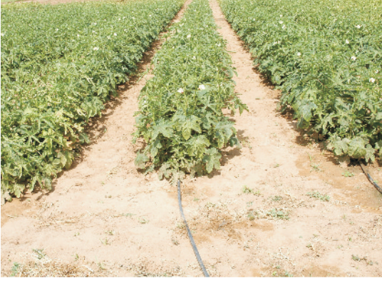
खेत में खड़ी भिण्डी की फसल