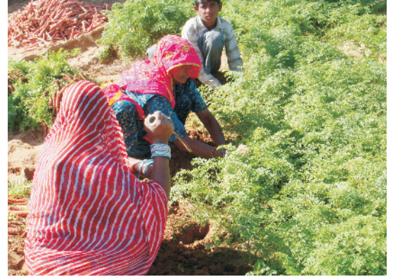
तैयार गाजर की खुदाई

फसल को बुआई से लगभग 4-6 सप्ताह तक खरपतवारों से मुक्त रखना चाहिए। इसके लिए बुआई के तीसरे तथा पाँचवे सप्ताह में खरपतवार निकालने के साथ-साथ खुरपी भी लगा देनी चाहिये। यदि फसल मेड़ पर बोई गई है तो गुड़ाई के साथ-साथ मेड़ों पर मिट्टी भी चढ़ा देनी चाहिये। खरपतवारनाशी रसायनों जैसे पेन्डीमिथेलिन अथवा नाइट्रोफेन की 1 कि.ग्रा. प्रति हेक्टेयर की दर से बुआई से 2 दिन के अन्दर छिड़काव करने से खरपतवारों से निजात मिल जाता है।