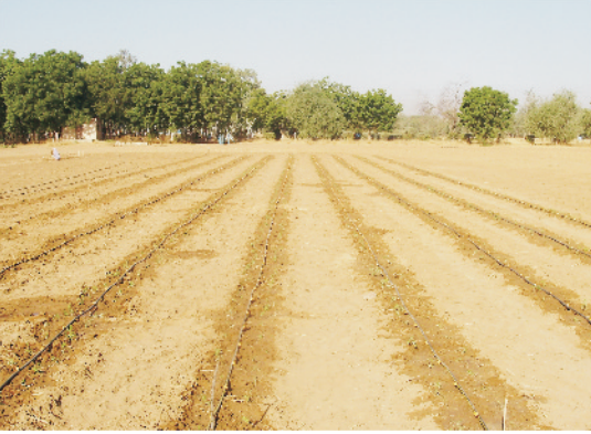
सब्जी उत्पादन में ड्रिप सिंचाई प्रणाली

पोषक तत्वों एवं विभिन्न प्रकार की दवाओं का भी उपयोग किया जा सकता है। यह प्रणाली खरपतवार नियंत्रण में भी सहयोग करता है। ड्रिप प्रणाली ऊबड़-खाबड़ एवं क्षारीय जमीन में भी उपयोगी है और इससे अगेती फसल की भी प्राप्ति होती है। रासायनिक खाद, मजदूरी एवं अन्य खर्चों में कटौती के साथ-साथ इस प्रणाली को अपनाने से समय की भी बचत होती है।