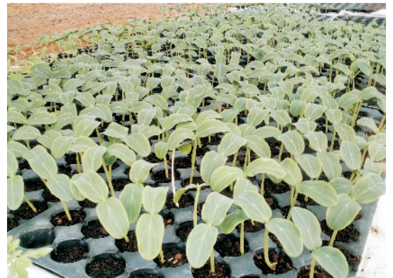
अगेती फसल हेतु प्रो-ट्रेज में पौध उत्पादन

यह पद्धति वैसे तो कई तरह की फसलों के लिए प्रयुक्त होती है परंतु खीरा, लौकी, खरबूजा, तरबूज, टिंडा, करेला, तोरी व चप्पन-कद्दू के लिए काफी उपयुक्त है। इसके लिए सर्वप्रथम इन सब्जियों की पौध तैयार की जाती है, तत्पश्चात् इन्हे सीधे खेत में पॉली-टनेल में लगा दिया जाता है जहाँ इनकी उचित देखरेख की जाती है।