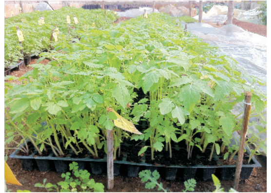
टमाटर की तैयार उन्नत पौध

नर्सरी तैयार करने से पूर्व भूमि को अच्छी तरह से शोधित कर इसमें उपस्थित हानिकारक जीवाणुओं व फफूंद तथा कीटों के लार्वा आदि को नष्ट कर देना चाहिए। इसके लिए गर्मी में खेत की गहरी जुताई, पौधशाला की पूर्णरूप से नम क्यारियों को अप्रैल–मई माह में पारदर्शी पॉलीथिन से ढँक कर भू-तपन प्रक्रिया, क्यारियों को भूमि धरातल से ऊँची (10–15 से.मी.) बनाकर बुआई से पूर्व (12–15 दिन) फोर्मलीन घोल (1–2% सांद्रता) द्वारा उसे तर करने के पश्चात लगभग एक सप्ताह तक पॉलीथिन से भली-भांति ढँक कर रखना, आदि द्वारा पौधशाला की भूमि को शोधित कर सकते हैं। इसके अलावा बीज बुआई से पूर्व गोबर की खाद में ट्राइकोडर्मा मिलाकर क्यारी की मिट्टी में अच्छी तरह से मिला सकते हैं।