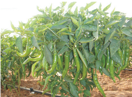
सब्जी फसल में ड्रिप सिंचाई प्रणाली

लगभग सभी प्रकार की सब्जी फसलें पंक्तियों में उगाई जाती हैं और इनमें टपक सिंचाई पद्धति का इस्तेमाल आसानी से किया जा सकता है।