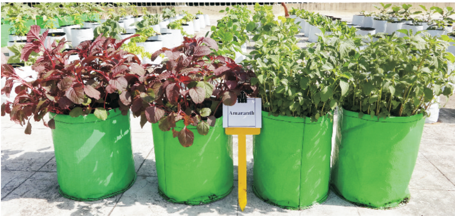
तैयार चौलाई की फसल

एक हेक्टेयर क्षेत्र की बुआई के लिए 1.5–2.0 कि.ग्रा. बीज की आवश्यकता पड़ती है। ग्रीष्म ऋतु की फसल की बुआई फरवरी—मार्च एवं वर्षा ऋतु की फसल की बुआई जून—जुलाई में करते हैं। साधारणतया ग्रीष्मकालीन फसल की पैदावार अधिक व गुणवत्तायुक्त होती है, जबकि वर्षा ऋतु में पत्तियाँ कीड़ों से प्रभावित हो जाती हैं जिससे काफी नुकसान होता है।