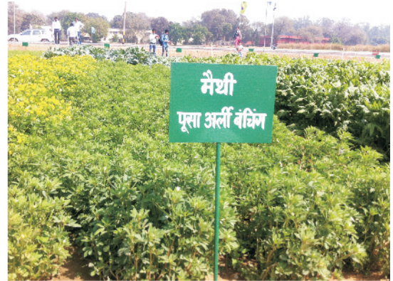
खेत में खड़ी मेथी की फसल

मेथी की खेती शरद ऋतु में की जाती है। इसमें ठंड व पाला सहन करने की अच्छी शक्ति होती है। पालक की तरह ही मेथी की भूमि होनी चाहिए हालाँकि मेथी अपेक्षाकृत अधिक क्षारीय भूमि और खारे पानी को भी सहन करने में सक्षम है।