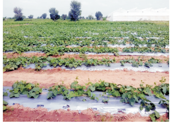
सब्जी उत्पादन में मल्लिचग का उपयोग

घास-फूस से सतह पर की गयी पलवार मृदा नमी को बचाने में काफी सहायक होती है। सतही पलवार से भूमि के तापमान में कमी आती है, फलस्वरूप जल वाष्पन कम हो जाता है। सतही पलवार के रूप में उपलब्धता के आधार पर फसलों के अवशिष्ट अंश, पत्तियाँ, सूखी घास, लकड़ी का बुरादा या पॉलिथीन की चादरें काम में ली जा सकती हैं।