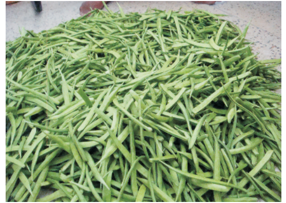
तुड़ाई पश्चात् ग्वार की फलियाँ

बीज, किसी विश्वसनीय संस्था से लेना चाहिए तथा किस्म की पहचान, प्रमाणीकरण, आदि की जानकारी सुनिश्चित कर लेनी चाहिए। बीज की बुआई 45-60 से.मी. दूरी पर बनी पंक्तियों में 15-20 से.मी. के अन्तराल पर करना चाहिए। अच्छे बीज उत्पादन के लिए खेत को हमेशा खरपतवारों, कीटों तथा बीमारियों से मुक्त रखना चाहिए। अन्य शस्य क्रियाएं इसकी फलियों के उत्पादन की तरह ही हैं। बीज बरसात वाली फसल से लेना लाभकारी होता है, क्योंकि इस दौरान बीज अपेक्षाकृत स्वस्थ तथा अधिक मात्रा में प्राप्त होता है। अच्छी फसल से प्रति हेक्टेयर औसतन 1000 कि.ग्रा. बीज प्राप्त किया जा सकता है।