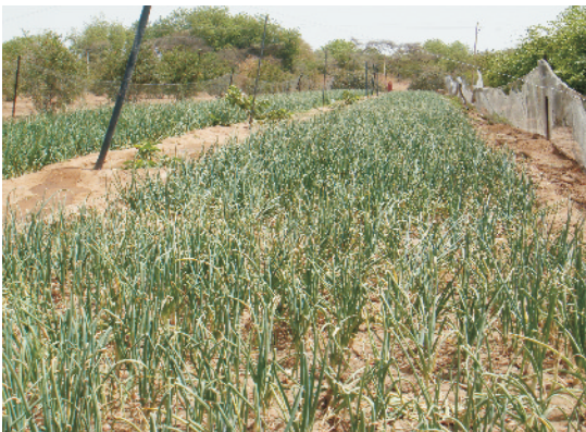
खेत में तैयार प्याज की फसल

पौध लगभग 7–8 सप्ताह में रोपाई योग्य हो जाती है। खरीफ फसल के लिए रोपाई का उपयुक्त समय जुलाई के अन्तिम सप्ताह से लेकर अगस्त तक है। रोपाई करते समय कतारों के बीच की दूरी 15 से.मी. तथा पौधे से पौधे की दूरी 10 से.मी. रखते हैं।