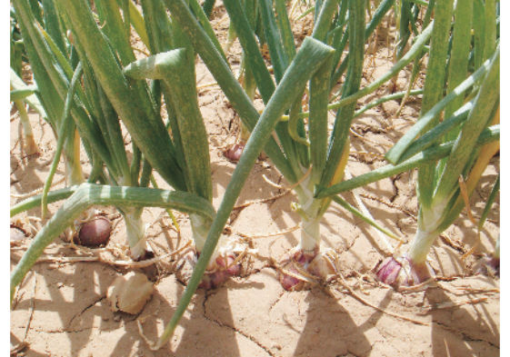
खेत में खड़ी प्याज की फसल

रबी की फसल के लिए नर्सरी में बीज की बुआई नवम्बर में करनी चाहिए। खरीफ फसल दो प्रकार से ली जाती है – एक तो बीज द्वारा पौधा बनाकर तथा दूसरी, बीज द्वारा पहले छोटे-छोटे कन्द व कन्दों की पुनः बुआई करके। बीज द्वारा पौधा बनाकर फसल लेनी हो तो, प्याज की बुआई मई के अन्तिम सप्ताह से लेकर जून के मध्य तक करते हैं। यदि गन्धियों द्वारा खरीफ में अगेती फसल लेनी हो तो बीज की बुआई जनवरी के अन्तिम सप्ताह में या फरवरी के प्रथम सप्ताह में करते हैं। कन्दों की बुआई पुनः अगस्त माह में करते हैं।