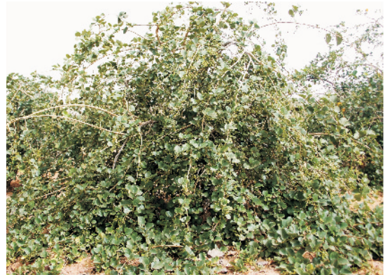
फलों से लदा गून्दे का पेड़

गून्दा को लसोड़ा तथा लेहसुआ के नाम से भी जाना जाता है। उत्तर पश्चिमी राजस्थान के बाड़मेर, जोधपुर, जैसलमेर, अजमेर, पाली, सिरोही आदि जिलों में बागवानी के रूप में इसकी खेती की जाती है। खेती के लिए अनुपयुक्त कम उर्वरा वाली जमीन में भी इसकी खेती की जा सकती है। यह एक बहुउपयोगी वृक्ष है जिसके कच्चे फल सब्जी व अचार बनाने, हरे पत्ते पशुओं के चारे के रूप में, लकड़ी कृषि यन्त्रों तथा हैण्डिकाफ्ट इत्यादि में काम आते हैं। फलों में औषधीय गुण भी विद्यमान है जोकि डायबटीज, मूत्रविकार आदि रोगों में कारगर है। अप्रैल के शुरुआत में आने वाले कच्चे फलों का बाजार भाव काफी ऊंचा रहता है अतः किसान भाई इसकी खेती करके अच्छा लाभ कमा सकते हैं।