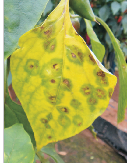
मिर्च में श्याम वर्ण ( एन्थ्रेक्नोज ) रोग के प्रकोप का लक्षण

नियंत्रण: मैन्कोजेब 2 ग्राम या क्युमान एल 1.0 मिली प्रति लीटर पानी के घोल का 15 दिन के अन्तराल पर 2–3 छिड़काव करें।