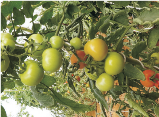
पौधो पर लगे टमाटर के गुच्छे

टमाटर में अधिक फूल गिरने की समस्या होने पर तथा उपज बढ़ाने के लिए प्लेनोफिक्स (NAA) की 4—5 मिली प्रति टंकी या 50 मिली प्रति एकड़ की दर से का छिड़काव से अधिक फल बनते हैं। इसके अलावा सूक्ष्म पोषक तत्व बोरॉन की कमी के लक्षण प्रकट होने पर बोरेक्स 0.6 प्रतिशत की दर से खड़ी फसल में छिड़काव करना चाहिए।