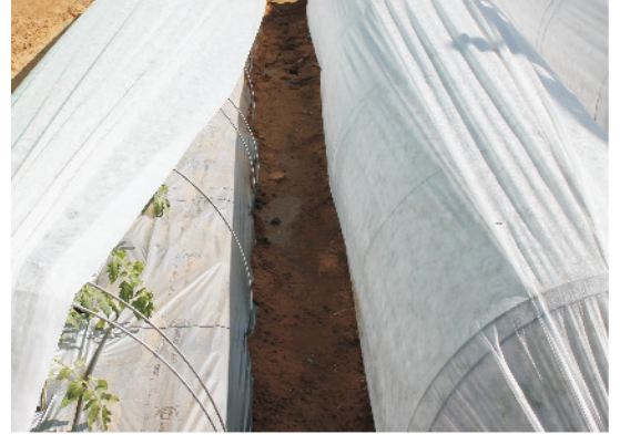
लो-टनेल के अन्दर सब्जी उत्पादन

संरचना लघु स्तर पर पौधों को ग्रीनहाउस का प्रभाव मुहय्या कराती है जिसके कारण बाहर की अपेक्षा टनेल के अंदर पौधों के आस-पास का तापक्रम अधिक रहता है और पौधों की वृद्धि व विकास होता रहता है जिससे फसल उत्पाद सामान्य फसल की अपेक्षा 30-45 दिन पूर्व प्राप्त हो जाते हैं।