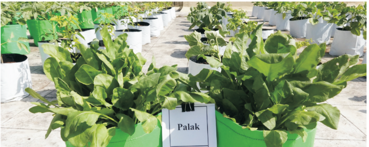
तैयार पालक के पत्ते

खेत की 2–3 जुताई करके मिट्टी को भुरभुरी बना लेना चाहिए। बुआई के पूर्व खेत में छोटी-छोटी क्यारियाँ और सिंचाई की नालियाँ बना लेनी चाहिए। बुआई के 3–4 सप्ताह पूर्व 20–25 टन प्रति हेक्टेयर की दर से गोबर की सड़ी खाद या कम्पोस्ट डालकर मिट्टी में अच्छी तरह मिला देना चाहिए। इसके अलावा सामान्य दशा में 100 कि.ग्रा. नत्रजन, 50 कि.ग्रा. फास्फोरस और 50 कि.ग्रा. पोटाश प्रति हेक्टेयर की दर से शरदकालीन फसल में डालते हैं। फास्फोरस और पोटाश की पूरी मात्रा और नत्रजन की एक चौथाई मात्रा आपस में मिलाकर बुआई के पूर्व खेत में डालकर मिट्टी में मिला देना चाहिए। शेष नत्रजन बराबर मात्रा में बाँटकर प्रत्येक कटाई के बाद देते हैं। शरदकालीन फसल में औसतन 3–4 बार टॉप ड्रेसिंग (ऊपर से छिड़काव) करते हैं। गर्मी की फसल में उर्वरक की मात्रा आधी हो जाती है क्योंकि केवल एक ही कटाई मिल पाती है।