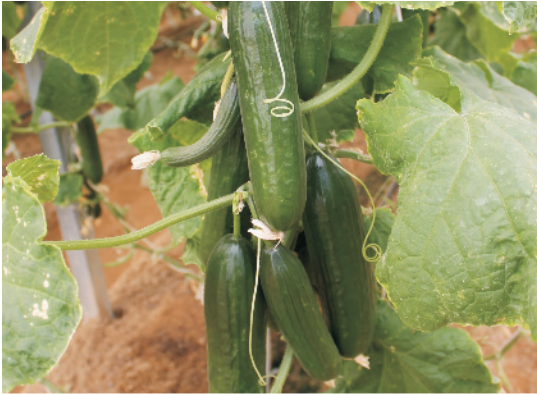
सहारा दिए हुए खीरे का पौधा

खासकर वर्षा वाली फसल में और बीज रहित खीरे की किस्मों के पौधों को सीधा रखना चाहिए। इसके लिए बाँस या लोहे के पोल पर तार के सहारे सुतली से बाँधकर पौधों को सहारा देना चाहिए। इससे पौधों के आस-पास उचित वायु-संचार, फूलों पर आसानी से मधुमक्खियों का विचरण व अच्छे से परागण से फलों के अधिक पैदावार के साथ-साथ उनकी गुणवत्ता में भी उत्तम होती है।