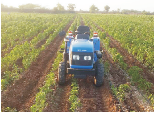
मिर्च की फसल में निराई-गुड़ाई