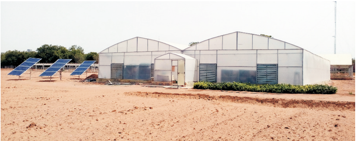
काजरी में सौर ऊर्जा आधारित फैन-पैड पॉलीहाउस

ग्रीनहाउस/पॉलीहाउस का इस्तेमाल आमतौर पर ठंडे इलाकों में सर्दियों के मौसम में जब बाहर फसल लेना संभव नहीं होता था तब किया जाता था, परन्तु आजकल पश्चिमी राजस्थान में जहाँ गर्मियों में तापक्रम 45 डिग्री सेन्टीग्रेड से भी अधिक चला जाता है वहाँ भी इसका सफलतम उपयोग होता देख सकते हैं। इसकी वजह इसकी संरचना व बनावट में आए बदलाव है। आज पॉलीहाउस के अंदर के तापमान को कम करने के लिए शेड नेट व फौगर, जबकि कहीं-कहीं तो बाहर की हवा को ठंडा कर अंदर तथा अंदर की गर्म हवा बाहर फेंकने वाले पंखे का भी इस्तेमाल किया जा रहा है। इसकी