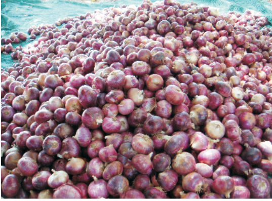
उन्नत प्याज उत्पादन

प्याज राजस्थान में उगायी जाने वाली एक महत्वपूर्ण व्यावसायिक नकदी सब्जी की फसल है। प्याज का उपयोग लगभग हर घर में प्रतिदिन किसी न किसी रूप में होता है। इसका इस्तेमाल सलाद, सब्जी, अचार एवं मसाले के रूप में किया जाता है। गर्मी में लू लग जाने तथा गुर्दे की बीमारी में भी प्याज लाभदायक रहता है।