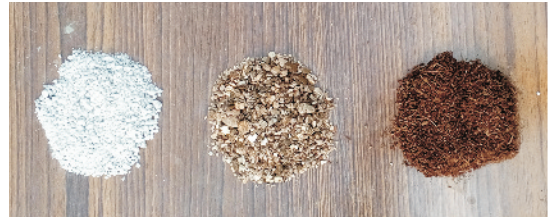
प्रो-ट्रेज हेतु मिट्टी रहित माध्यम- परलाइट, वर्मीकुलाइट एवं कोकोपीट

कोकोपिट को केचुएँ की खाद के साथ 4:1 के अनुपात में भी प्रयुक्त किया जा सकता है। प्रो-ट्रेज में सब्जियों के बीज की बुआई एक बीज प्रति छिद्र करते हैं। बुआई के पश्चात ट्रेज को 2-3 दिनों (अंकुरण होने से पूर्व) तक पॉलिथीन से ढंक देते हैं, इससे जमाव उत्तम व जल्दी होता है। एहतियात के तौर पर बीज जमाव के लगभग एक सप्ताह बाद कार्बेण्डाजिम + मेंकोजेब के मिश्रित रसायन की 2-2.5 ग्राम/लीटर के दर से पौधों की जड़ों को तर करने से नर्सरी के फफूंद जनित रोग जैसे आर्द्रपतन (डैम्पिंग ऑफ) के प्रकोप से बचा जा सकता है। एक छिड़काव कीटनाशी इमिडाक्लोप्रिड या थायमेटोक्साम (0.3-0.5 ग्राम/ली.) का कर सकते हैं। पोषण हेतु पौधों को एन.पी.के. (19:19:19) की 2 ग्राम/लीटर पानी के घोल की दर से एक सप्ताह के अन्तराल पर पौधों पर पर्णय छिड़काव करना चाहिए। मिट्टी की अपेक्षा प्रो-ट्रेज में पौधों की जड़ व तने का विकास तेजी से व समान होता है जिससे पौध लगभग एक सप्ताह पूर्व तथा एक साथ तैयार तैयार हो जाती हैं।