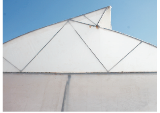
कीट नियंत्रक नेट हाउस

कीट नियंत्रक जाली का इस्तेमाल मुख्यतया नर्सरी में पौध तैयार करते समय किया जाता है। यह वायरस का प्रसार करने वाले कीटों जैसे सफेद मक्खी, चेपा, जैसिड, थ्रिप्स को पौधों के पहुँच से दूर रखने के लिए प्रयोग की जाती है। यह प्लास्टिक की बनी होती है जिसमें 40 से 60 छिद्र प्रति इंच होते हैं। इस जाली को नर्सरी के चारों तरफ किसी ढांचे पर फिट करते हैं। इसका इस्तेमाल स्व-वातानुकूलित पॉलीहाउस के किनारों पर कीटों के अंदर प्रवेश को रोकने के लिए भी होता है। इसके अलावा कभी-कभी इस प्रकार की संरचना के अन्दर व्यावसायिक स्तर पर शिमला मिर्च आदि फसलों का उत्पादन भी किया जाता है।