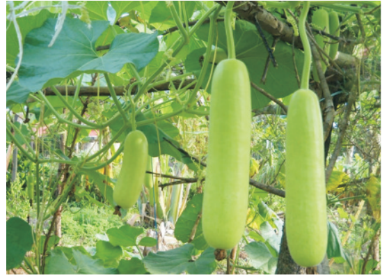
बेल से लटकते हुए लौकी के फल

लौकी के लिए 20-25 टन प्रति हेक्टेयर पूरी तरह से सड़ी गोबर की खाद या कम्पोस्ट बुआई के 3-4 सप्ताह पूर्व खेत में अच्छी तरह से मिला देना चाहिए। बहुत अच्छा होगा यदि मिट्टी परीक्षण के आधार पर उर्वरकों की मात्रा दी जाय। यदि यह संभव नहीं हो तो 120 कि.ग्रा. नत्रजन, 100 कि.ग्रा. फास्फोरस और 80 कि.ग्रा. पोटेश तत्व के रूप में देना चाहिए। नत्रजन की आधी मात्रा तथा फास्फोरस एवं पोटेश की पूरी मात्रा आखिरी जुताई के समय मिला देना चाहिए। नत्रजन की शेष आधी मात्रा खड़ी फसल में दो बार एक महीने की फसल होने पर तथा फूल आने की अवस्था पर पौधों की जड़ों के आस-पास डाल कर हल्की सिंचाई व निराई-गुड़ाई कर दें तथा जड़ों पर मिट्टी चढ़ा दें।