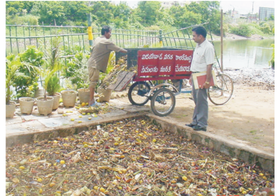
सब्जी मंडी एवं रसोई के कचरे को केचुओं खाद के लिए सड़ाना

जैविक अपशिष्टों को पृथक करके कचरे को 15-20 दिन तक सड़ाकर इसमें केचुओं को छोड़कर केचुआ खाद भी बनाई जा सकती है। यह खाद गुणात्मक रूप से अच्छी होती है।