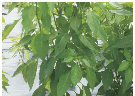
सब्जी उत्पादन में मल्व का प्रयोग

मल्व यानि पलवार का इस्तेमाल पौधों की जड़ों के पास के वातावरण को अनुकूल बनाने के लिए करते हैं। यह खरपतवार को नियंत्रित करने तथा जल संरक्षण में भी मदद करता है। सब्जी फसलों में व्यावसायिक स्तर पर पलवार के रूप में विभिन्न रंगों वाली सामान्यतः 25-30 माइक्रोन की प्लास्टिक फिल्म का इस्तेमाल किया जाता है। किसान भाई स्थानीय स्तर पर उपलब्ध फसलों के अवशेष, घास-फूस, पौधों की सूखी पत्तियाँ, आदि का प्रयोग कर सकते हैं। ड्रिप सिंचाई प्रणाली के साथ पलवार के प्रयोग से अपेक्षाकृत अधिक जल बचत, पौधों के उत्तम विकास व उत्पादन के साथ-साथ साफ तथा गुणवत्तापूर्ण उत्पाद प्राप्त किया जा सकता है, जिससे अपेक्षाकृत किसानों को उनके उत्पाद का बाजार भाव भी अधिक मिलता है।