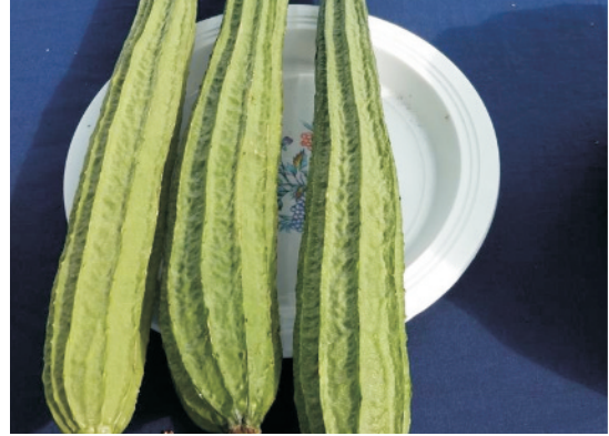
उन्नत तोरी के फल

कारण बीजों का जमाव अच्छा होता है तथा खेत में खरपतवार नहीं उग पाते जिसके फलस्वरूप पैदावार पर अनुकूल प्रभाव पड़ता है।