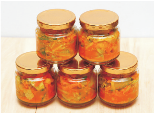
सब्जियों से बना अचार

एक किलो कटे हुए टमाटरों में पिसे हुए प्याज 100 ग्राम, अदरक 50 ग्राम, लहसुन 20 ग्राम मिलाकर पकायें। गरम होने पर 750 ग्राम चीनी मिलायें व पकाते रहें। चाशनी गाढ़ी होने पर पिसी लाल मिर्च 15 ग्राम व गरम मसाला 10 ग्राम मिलायें। गाढ़ी होने पर नमक मिलाकर नीचे उतारें व सोडियम बेंजोएट एक ग्राम प्रति किलो टमाटर की दर से अलग से घोल बनाकर मिलायें व बोतलों में भर दें।