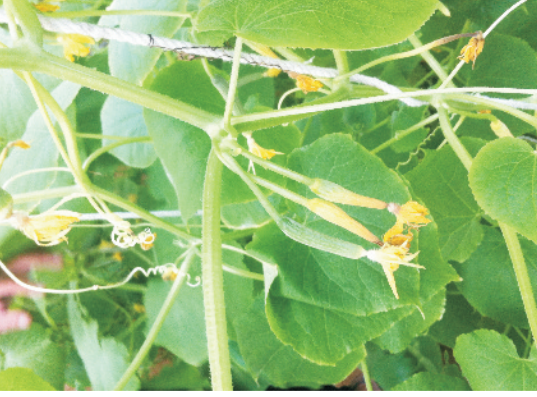
खीरे में बोरॉन तत्व की कमी के लक्षण

कमी की दशा व लक्षण: बोरॉन की उपलब्धता कम कार्बनिक पदार्थों वाली बालुआर, 7.5 पी.एच. से अधिक भूमिओं में कम होती है।