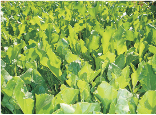
खेत में खड़ी पालक की फसल

एक हेक्टेयर क्षेत्र में बुआई के लिए 25–30 कि.ग्रा. बीज की आवश्यकता पड़ती है। बुआई का मुख्य समय अक्टूबर–नवम्बर है लेकिन इसकी बुआई लगभग पूरे वर्ष कर सकते हैं। बीज को प्रायः समतल खेत में छिटकवाँ विधि से बोते हैं परन्तु पंक्तियों में बोना अधिक लाभदायक होता है। इस विधि से पंक्तियों की दूरी 15–20 से.मी. रखते हैं। बीज की बुआई के समय पर्याप्त नमी होना आवश्यक है। बीज को 2–3 से.मी. गहराई पर बोते हैं। बीज जमने के बाद पौध से पौध की दूरी 4–5 से.मी. रखते हैं।