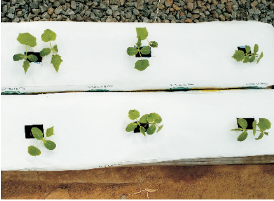
मृदा-रहित माध्यम में सब्जी उत्पादन

जैसे बालू-रेत, कंकड़, नारियल का बुरादा (कोको-पीट), परलाइट, आदि को किसी गमले, बैग, ट्रेफ, नलिका, टंकी, आदि, जिसमें पोषण-घोल का बहाव आसानी से बना रह सके, में भरकर उनमें पौधें लगाए जाते हैं। इस पद्धति में पौधे मृदा संबन्धित व्याधाओं के प्रकोप से बचे रहते हैं और उत्पाद भी उच्च कोटि का प्राप्त होता है।