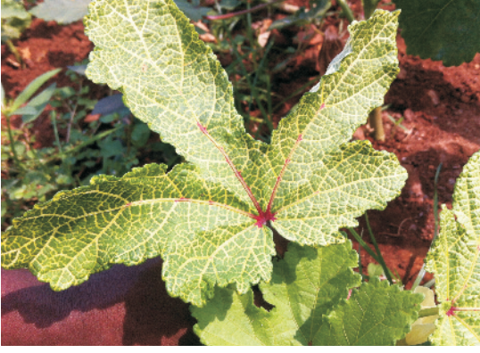
मोजैक रोग से ग्रसित भिण्डी की पत्ती