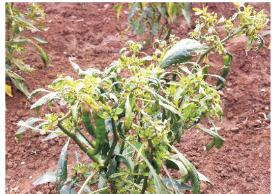
पर्णकुंचन मोजेक रोग के लक्षण

नियंत्रण: रोगग्रस्त पौधों को शीघ्र उखाड़कर नष्ट करें तथा रोग को आगे फैलने से रोकने के लिए रस चूसने वाले कीड़ों की रोकथाम पहले करें। फूल आने के बाद अन्य कीटनाशकों के स्थान पर इमिडाक्लोप्रिड 3 मिली प्रति 10 लीटर पानी या डाइमैथोएट 1.0 मिली प्रति लीटर पानी की दर से छिड़काव करें।