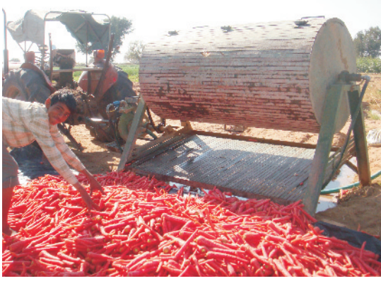
मशीन द्वारा गाजर की धुलाई