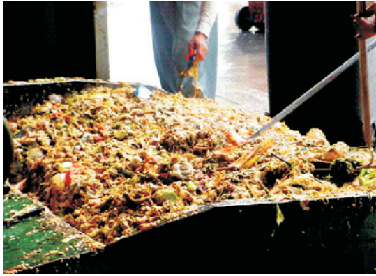
सब्जी प्रसंस्करण इकाइयों से निकला अपशिष्ट