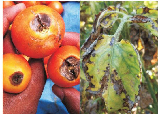
झुलसा रोग से ग्रसित टमाटर के फल व पत्ती

झुलसा/अंगमारी (अल्टरनेरिया): इस रोग से टमाटर के पौधों की पत्तियों पर गहरे भूरे रंग के धब्बे पड़ जाते हैं। यह रोग दो प्रकार का होता है। अगेती झुलसा— इस रोग में धब्बों पर गोल छल्लेनुमा धारियां दिखाई देती हैं। पछेती झुलसा— इस रोग से पत्तियों पर जलीय, भूरे रंग के गोल से अनियमित आकार के धब्बे बनते हैं। जिसके कारण अन्त में पत्तियाँ पूर्ण रूप से झुलस जाती हैं।