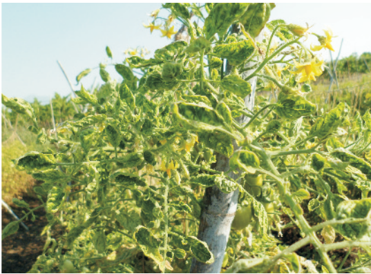
पर्ण कुंचन ( माथा बन्दी ) से ग्रसित टमाटर का पौधा

पर्णकुंचन (माथाबंदी): इस रोग में पौधों के पत्ते सिकुड़कर मुड़ जाते हैं तथा छोटे व झुर्रियुक्त हो जाते हैं। मोजेक रोग के कारण पत्तियों पर गहरे व हल्का पीलापन लिये हुए धब्बे बन जाते हैं। इस रोग को फैलाने में कीट सहायक होते हैं।