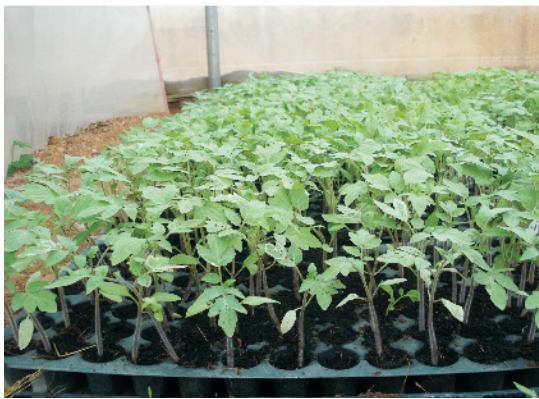
प्रो-ट्रेज में सब्जी पौध उत्पादन

अपेक्षाकृत अधिक सफल-स्वस्थ व समान वृद्धि वाली सब्जियों की पौध प्लास्टिक की बनी प्रो-ट्रेज में तैयार की जाती है। इसे 40-60 मेस की कीट-अवरोधी नायलान जाली युक्त ग्रीन/पॉलीहाउस के अंदर या फिर खुले में भी कर सकते हैं। बाजार में प्रो-ट्रेज विभिन्न आकार के प्लग या छिद्रों व इनकी संख्या के आधार पर बेंची जाती है। इसमें आमतौर पर 98 छिद्र वाली ट्रे (आकार 30X20X35 मिमी.) टमाटर, बैंगन, मिर्च के लिए, और 50 छिद्र वाली (40X30X45 मिमी. आकार) खीरा, खरबूजा, तरबूज, लौकी, कद्दू इत्यादि के लिए उपयुक्त होती हैं।