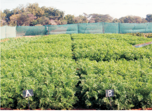
खेत में खड़ी गाजर की फसल

बीजों को राख के साथ रगड़ना भी जमाव के लिए अच्छा माना जाता है। बीज उगने के 2-3 सप्ताह के भीतर प्रत्येक पंक्ति में लगभग 5-7 से.मी. की दूरी छोड़कर फालतू पौधों को निकाल देना चाहिए, इससे पौधों की बढ़वार के लिए पर्याप्त स्थान मिलता है तथा जड़ों का विकास भी अच्छा होता है।