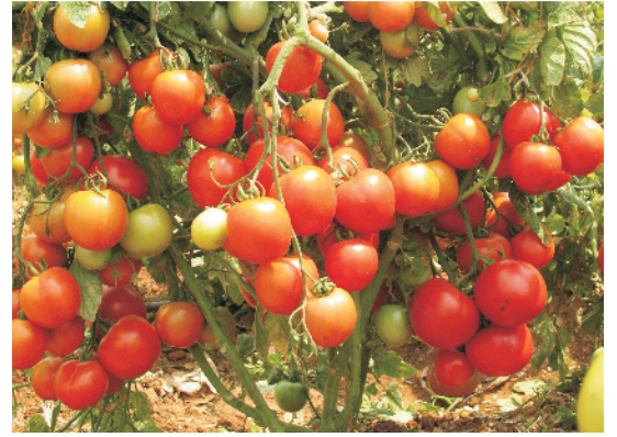
टमाटर की उन्नत किस्म पर लगे फल

कम उत्पादन का कारण है। इसलिए मुक्त-परागित किस्मों के बीज 2-3 वर्षों के अंतराल पर जबकि संकर किस्मों के बीज हर बार नया उपयोग में लेना चाहिए। कृषि अनुसंधान केन्द्रों अथवा कृषि विश्वविद्यालयों द्वारा उस क्षेत्र के लिए संस्तुत किस्मों का ही चुनाव करना चाहिए।