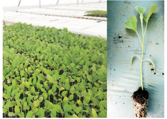
बैंगन की उन्नत तैयार पौध

ग्राम/किलो बीज) से उपचारित करना चाहिए। गर्मी की फसल के लिए दिसम्बर-जनवरी में तथा सर्दी की फसल के लिए सितम्बर में बुआई करनी चाहिए। एक हेक्टेयर खेत में पौध रोपाई करने हेतु 350 से 500 ग्राम बीज तथा संकर किस्मों के लिए 150 से 200 ग्राम बीज पर्याप्त रहता है।