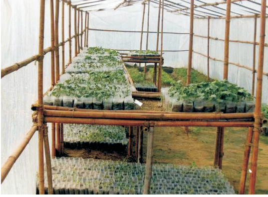
पॉलीथिन की थैलियों में सब्जी पौध उत्पादन