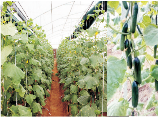
पॉलीहाउस में खीरे की फसल