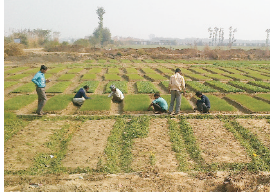
उठी हुई क्यारी में सब्जी पौध उत्पादन

कार्बनिक खाद मिलाएं। मिट्टी में उचित जलधारण करने की क्षमता व वायुसंचार अच्छा होना चाहिए। पौधशाला का स्थान खरपतवार, हानिकारक रोग, कीटाणुओं, सूत्रकृमी, इत्यादि से मुक्त होना चाहिए। इस हेतु प्रयुक्त सामग्री स्थानीय स्तर पर सस्ते दरों पर उपलब्ध होनी चाहिए।