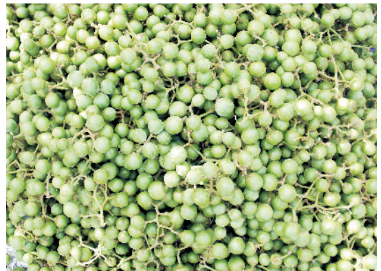
बिक्री के लिए तैयार गूँदे के फल

गूँदे में प्रतिवर्ष नियमित कटाई-छंटाई की जरूरत नहीं पड़ती, परन्तु रोपाई के बाद 2-3 साल में मजबूत तथा संतुलित शाखाएँ विकसित करने के लिए छंटाई आवश्यक है। पूर्ण विकसित पेड़ से अत्यधिक शाखाएँ सूखी एवं रोगग्रस्त टहनियों को समय-समय पर काटते रहना चाहिए। पत्ते की तुड़ाई गूँदे में एक नियमित तथा नितान्त आवश्यक प्रक्रिया है। कलियाँ विकसित होने तथा फूल खिलने के लिए गूँदे के पेड़ों को कुछ दिनों के लिए सुषुप्तावस्था आवश्यक है। इसके लिए नवम्बर से जनवरी तक पेड़ों को पानी देना बन्द कर देना चाहिए। सभी पत्ते एक साथ एक समय पर गिरने से फूल व