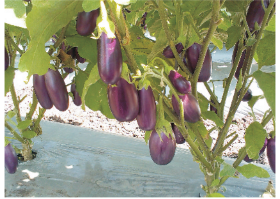
फलों से लदा बैंगन का पौधा