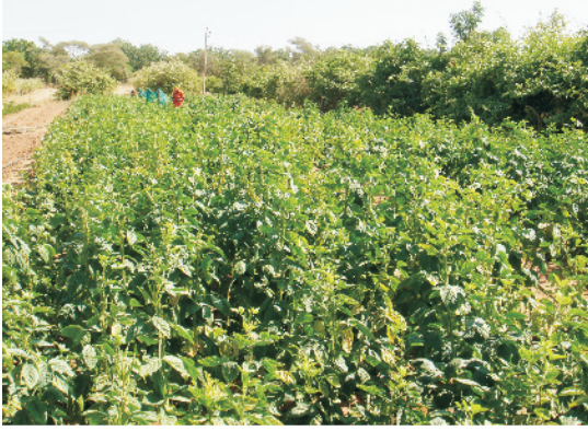
खेत में ग्वारफली की खड़ी फसल

रहना चाहिए। खरपतवारनाशी रसायनों के प्रयोग से भी खरपतवारों से निजात पायी जा सकती है। खेत तैयार करते समय बासालिन या ट्रेपलान 1-1.5 कि.ग्रा. प्रति हेक्टेयर की दर से भूमि की ऊपरी परत में मिलाने से फसल के दौरान उगने वाले खरपतवारों को प्रभावी रूप से नियन्त्रित किया जा सकता है।