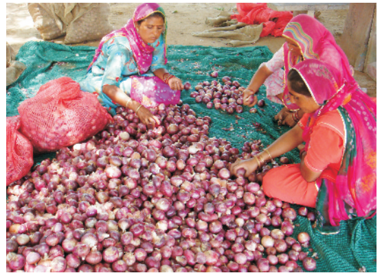
भण्डारण हेतु प्याज की छंटाई

सब्जियों में छंटाई का उद्देश्य कटी-फटी व असामान्य आकार वाली सब्जियों को अलग करना है। छंटाई से उत्पाद प्रभावशील व आकर्षक दिखता है जिससे बाजार में उनका अच्छा मूल्य मिल पाता है। छंटाई की प्रक्रिया खेत में तुड़ाई के तुरन्त बाद ही करनी चाहिए ताकि कटी-फटी सब्जियों के परिवहन व विपणन में होने वाले खर्च से बचा जा सकें।