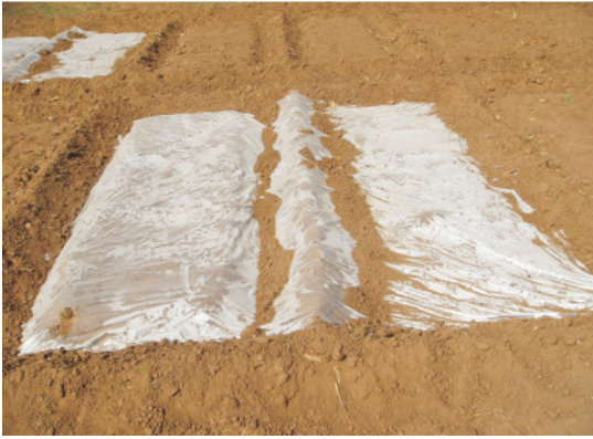
मृदा सौर्यीकरण द्वारा नर्सरी भूमि का उपचार

ढँककर या फिर फोर्मलीन के 2 प्रतिशत घोल से तर करने के पश्चात पॉलिथीन से 2-3 सप्ताह तक ढँक करके, कर सकते हैं। चाहे भूमि शोधन किया गया हो या नहीं, बुआई से पूर्व पौधशाला की क्यारी की मिट्टी को फफूँदनाशी जैसे ट्राइकोडर्मा की 1 कि.ग्रा. मात्रा 25 कि.ग्रा. गोबर की खाद के साथ 4-5 दिन गीले जूट की बोरी से ढकने के बाद मिट्टी में छिड़क कर मिलाना चाहिए अथवा कैप्टान या थाइराम (5 ग्राम/वर्ग मी.) रसायन से उपचारित करना चाहिए। नर्सरी में कीटों के प्रकोप से बचाव हेतु कार्बोफ्यूथ्रान या क्लोरपाइरीफॉस (5 ग्राम/वर्ग मी.) को क्यारी की तैयारी करते समय मिट्टी में अच्छी प्रकार से मिला देना चाहिए।