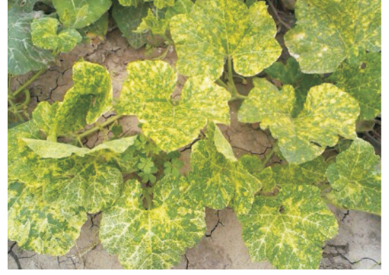
मोजेक वायरस ग्रसित पौधा

नियंत्रण: मक्का, ज्वार या बाजरा को फसल की मेड़ों पर या अन्तः सस्यन के रूप में उगाना चाहिए जो कीट के लिए अवरोधक का कार्य करती हैं और इससे सफेद मक्खी का प्रकोप कम हो जाता है। सफेद मक्खी के नियंत्रण हेतु कीटनाशक जसे इमिडाक्लोप्रिड 17.8 एस एल 0.5 ग्राम/लीटर या थायोमिथोक्जाम 25 डब्ल्यू जी 0.35 ग्राम/लीटर से छिड़काव करने से इस कीट पर नियंत्रण प्राप्त किया जा सकता है।