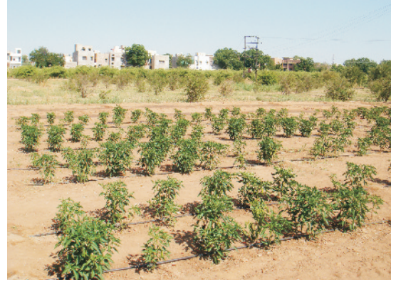
खेत में खड़ी मिर्च की फसल

रोपण के लिए लगभग 1.5 कि.ग्रा. बीज, जबकि संकर किस्मों के लिए 400–500 ग्राम बीज प्रति हेक्टेयर पर्याप्त होता है। नर्सरी में पौधों को कीड़ों के प्रकोप से बचाने के लिए इमिडाक्लोप्रिड 17.8 एस.एल. की 3 मिली प्रति 10 लीटर पानी के हिसाब से घोल बनाकर छिड़काव करें।