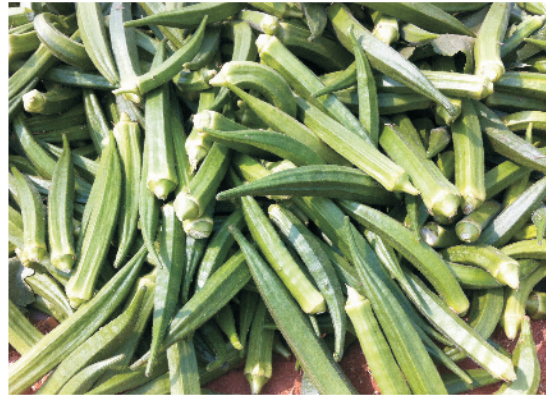
भिण्डी की तुड़ाई की हुई फलियाँ

भिंडी की फलियों की तुड़ाई उनकी नर्म अवस्था, उनके कड़े होने या बीज बनने से पहले की स्थिति में करके छाया में रखें। फलियों की तुड़ाई नियमित अंतराल पर करते रहें। स्थानीय बाजार के लिए सुबह तुड़ाई करके बाजार में भेज सकते हैं लेकिन दूरस्थ बाजार के लिए शाम के समय तुड़ाई करके भिंडी की फलियों को जूट के बोरों या टोकरी में भरकर सुबह बाजार में भेजते हैं जिससे फलियों को कोई हानि न हो। फलियों को 4 से 10 डिग्री सेन्टीग्रेड तापमान पर 4–5 दिन तक भंडारित किया जा सकता है।