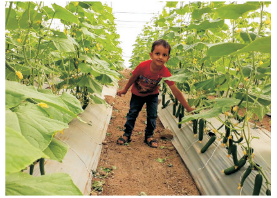
पॉलीहाउस में खीरे की उन्नत फसल