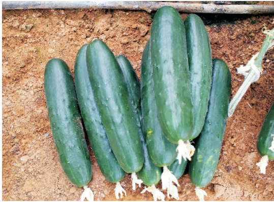
खीरे के ताजे तोड़े गये फल

लता वाली सब्जियों में खीरे का महत्वपूर्ण स्थान है। खीरा गर्म जलवायु की फसल है जिसकी उत्पत्ति मूलतः भारत से ही हुई है। इसकी खेती लगभग पूरे भारतवर्ष में की जाती है। खीरे के फल को सलाद के रूप में उपयोग किया जाता है। इसके फलों की तासीर ठंडी होती है और इसे खाने से पाचन शक्ति अच्छी रहती है। खीरे के 100 ग्राम ताजे फल में औसतन 0.4 प्रतिशत प्रोटीन, 2.5 प्रतिशत कार्बोहाइड्रेट, 1.5 मिलीग्राम आयरन, 2.0 ग्राम विटामिन 'सी' पाया जाता है।