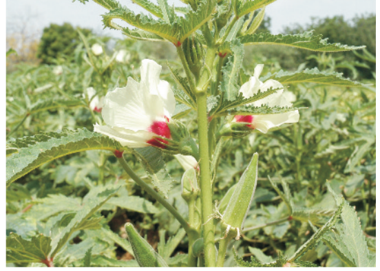
पौधे पर लगी भिण्डी के फूल व फलियाँ