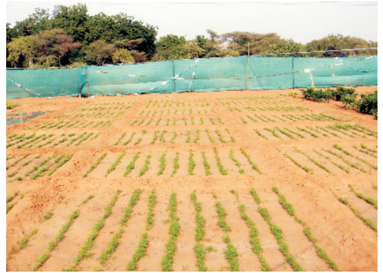
गाजर की शुरूआती पौध बढवार की अवस्था

बीज की मात्रा बुआई के समय, भूमि के प्रकार, बीज की गुणवत्ता आदि पर निर्भर करती है, जो प्रति हेक्टेयर 5 से 8 कि.ग्रा. तक हो सकती है। अगेती फसल की बुआई हेतु अपेक्षाकृत अधिक बीज की आवश्यकता पड़ती है। हल्की क्षारीय भूमि में तथा बुआई पश्चात् पपड़ी बनने की दशा में सघन बुआई करने की वजह से बीज की मात्रा बढ़ जाती है। गाजर की बुआई जुलाई से लेकर नवम्बर तक की जा सकती है, परन्तु अक्टूबर में बोई जाने वाली फसल उत्पादन तथा गुणवत्ता दोनों दृष्टि से सर्वोत्तम मानी जाती है। भारी मिट्टी में बुआई मेड़ों पर जबकि रेतीली मिट्टी में समतल क्यारियों में करनी चाहिए।