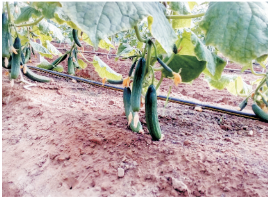
पॉलीहाउस में खीरे के फलन की शुरूआती अवस्था

साधारण (प्राकृतिक वायु प्रवाही) पॉलीहाउस में ठंड के मौसम में रात को खिड़की दरवाजे बंद रखते हैं जबकि गर्मियों में तापक्रम न बढ़ने देने के लिए इन्हें दिन रात खुला रखने की आवश्यकता पड़ती है।