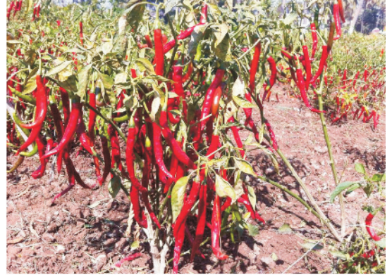
लाल मिर्च के फलों से लदे पौधे

बारिश नहीं होने पर आवश्यकतानुसार हल्की सिंचाई करते रहना चाहिए। गर्मियों में 5-6 दिन के अन्तराल पर जबकि सर्दियों में 10-15 दिन के अन्तराल पर सिंचाई करनी चाहिए। अच्छा उत्पादन प्राप्त करने के लिए पहली निराई-गुड़ाई पौध रोपाई के 20 दिन बाद तथा दूसरी 15 दिन के अन्तराल पर करके खेत को खरपतवार रहित रखना चाहिए। फसल की सिंचाई ड्रिप विधि से भी की जा सकती है। खरपतवार नियंत्रण हेतु 300 ग्राम ऑक्सीफ्ल्यूओरफेन का पौध रोपण से ठीक पहले 600-700 लीटर पानी में घोल बनाकर छिड़काव करना चाहिए।