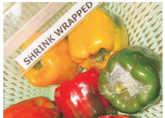
शिमला मिर्च के फलों में श्रिंक रैपिंग

सब्जियों की दुलाई, भण्डारण, विपणन व परिवहन के दौरान ताजा बनाये रखने के लिए उचित पैकिंग अति आवश्यक कदम है। विभिन्न प्रकार की सब्जियों के लिए अलग-अलग तरह की पैकिंग सामग्री का प्रयोग किया जाता है। आमतौर से भारत में जूट बैग्स, कागज व लकड़ी के कार्टन, बांस की टोकरियाँ, प्लास्टिक बैग इत्यादि प्रयोग की जाती हैं।