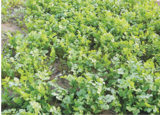
गृह वाटिका की क्यारी में खड़ी धनिया की फसल

सर्वप्रथम 30–40 से.मी. की गहराई तक कुदाली या हल की सहायता से जुताई करें। खेत से पत्थर, झाड़ियों एवं बेकार के खरपतवार को हटा दें। खेत में अच्छे ढंग से निर्मित 100 कि.ग्रा. कृमि या केंचुए की खाद चारों ओर फैला दें। आवश्यकता के अनुसार 45 से.मी. या 60 से.मी. की दूरी पर मेड़ या क्यारी बनाएँ।