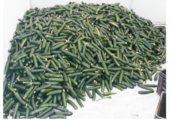
तुड़ाई पश्चात् खीरे की उपज

खीरे की बेल (लता) की वृद्धि की प्रारंभिक अवस्था में निराई-गुड़ाई करने से पौधों का अच्छा विकास होता है और फलन भी अधिक होता है। बुआई के 2 से 3 दिन के अंदर पेंडीमेथालीन के 1.0 लीटर सक्रिय तत्व को 1000 लीटर पानी में मिलाकर प्रति हेक्टेयर छिड़काव करने से शुरुआत में खरपतवार से काफी राहत मिलती है। इसके अलावा खेत को साफ सुथरा रखने हेतु समय-समय खरपतवारों को निकालते रहना चाहिए।