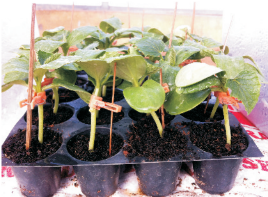
ग्राफ्टिंग द्वारा सब्जी पौध उत्पादन

बहुवर्षीय फल-वृक्षों के विपरीत, सब्जियों में ग्राफ्टिंग का उपयोग एक नवाचार है। चूंकि आमतौर पर उत्तम उत्पादन व गुणवत्ता की क्षमता वाली व्यावसायिक किस्में सामान्य दशा में तो अच्छी चलती हैं परंतु किसी विशेष प्रतिकूल परिस्थिति (जैविक व अजैविक कारकों) होने पर इनकी उत्पादन क्षमता पर प्रतिकूल प्रभाव पड़ता है अर्थात् इनका उत्पादन कम होता है। इस दशा में इन किस्मों के तने (शांकुर-ऊपरी भाग) को प्रतिकूल परिस्थिति के प्रति उपयुक्त कठोर या असहिष्णु चयनित किस्म (मूलवृंत- देशी/जंगली या विशेष परिस्थिति के प्रति तैयार किस्म) के तने के ऊपर ग्राफ्टिंग प्रक्रिया द्वारा पौधों की शुरुआती अवस्था में जोड़ा जाता है। इस तरह तैयार पौधों में दोनों पौधों के विशिष्टतम गुण आ जाते हैं और इसमें प्रतिकूल परिस्थितियों से लड़ने की क्षमता बढ़ जाती है तथा इनके कारण उन परिस्थितियों में भी उत्पादन व गुणवत्ता में अपेक्षाकृत कमी कम होती है।