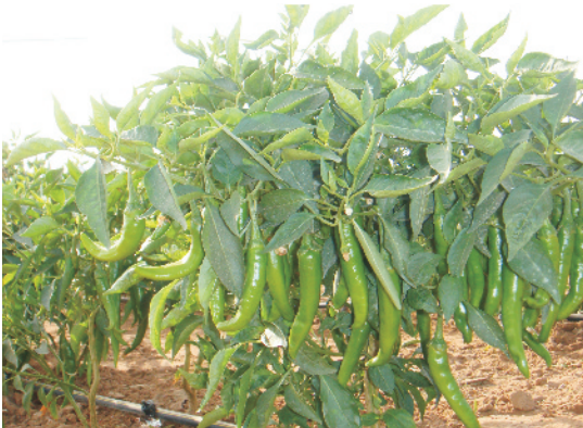
हरी मिर्च के फलों से लदे पौधे

हरी मिर्च रोपण के लगभग 85-90 दिन बाद तोड़ने योग्य हो जाती है। इस तरह 1-2 सप्ताह के अन्तर पर पके फलों को तोड़ा जाता है। हरी चरपरी मिर्च की उपज लगभग 100-150 क्विंटल प्रति हेक्टेयर तथा इसी उपज से 15-25 क्विंटल सूखी लाल मिर्च प्राप्त की जा सकती है।