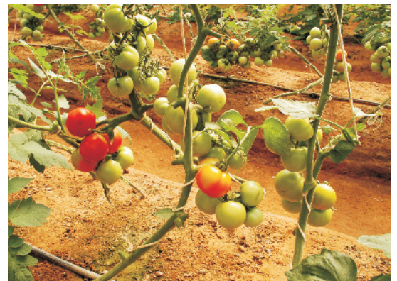
सहारा (स्टेकिंग) दिए हुए टमाटर के पौधे

टमाटर की फसल से अच्छा उत्पादन लेने के लिए सिंचाई की उत्तम व्यवस्था होनी चाहिए। गर्मी के दिनों में 6-7 दिन के अन्तराल पर, जबकि सर्दी में 10-15 दिनों के अन्तराल पर हल्का पानी देते रहना चाहिए। अगर संभव हो सके तो सिंचाई बूँद-बूँद (ड्रिप) पद्धति द्वारा करनी चाहिए। बूँद-बूँद सिंचाई से लगभग 60-70 प्रतिशत पानी की बचत के साथ-साथ 20-25 प्रतिशत अधिक उत्पादन प्राप्त किया जा सकता है।