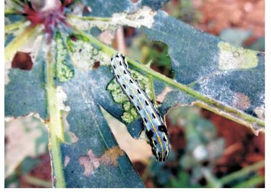
पत्ती छेदक लट

नियंत्रण: इमिडाक्लोप्रिड या एसीटामीप्रिड (0.3–0.5 मि.ली./लीटर पानी) रोपाई के 20 दिन बाद तथा आवश्यकतानुसार 15 दिन के अंतराल पर प्रयोग करें।