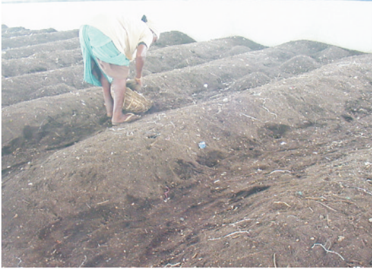
पृथक किये हुए शहरी जैविक कचरे से क्रेचुओं खाद बनाना