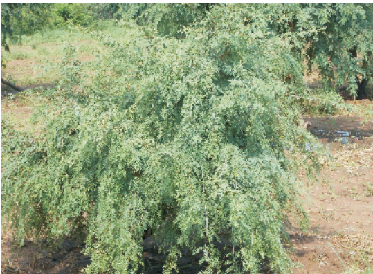
कलम से तैयार खेजड़ी का पौधा

केन्द्रीय शुष्क बागवानी संस्थान, बीकानेर में उत्तम गुणवत्ता की सांगरी हेतु के-1, के-2, के-13, के-16 व के-17 चयनों को अति उत्तम पाया गया है। अब सांगरी उत्पादन हेतु खेजड़ी की किस्मों पर वानस्पतिक विधि से प्रवर्धन कर हजारों की संख्या में उन्नत किस्मों के पौधे तैयार