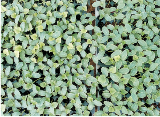
गुणवत्तापूर्ण उन्नत सब्जी की नर्सरी

इनके अलावा आमतौर पर सीधे खेत में बीज से बुआई की जाने वाली कट्टवर्गीय कुल की सब्जियों (जैसे—खीरा, खरबूजा, तरबूज, लौकी, तोरी आदि) की गर्मी की अगेती फसल लेने हेतु या फिर ग्रीनहाउस में (जैसे खीरा, खरबूजा) उत्पादन हेतु इनकी पौध पहले मिट्टी आधारित पॉलिथीन की थैलियों में या फिर मिट्टी रहित माध्यम में प्लास्टिक की 'प्रो-ट्रे' या 'सीडलिंग-ट्रे' में तैयार की जाती है।