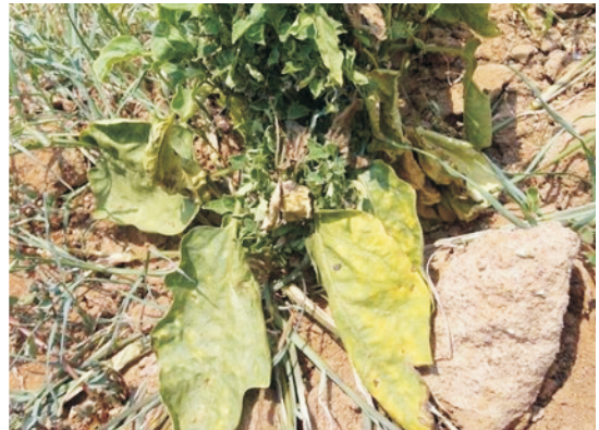
'लिटल लीफ' रोग से ग्रसित बैंगन का पौधा

लिटल लीफ: यह माइकोप्लाजमा जनित रोग है। इस रोग से ग्रसित पौधों की पत्तियाँ छोटी व पीली पड़ जाती हैं और पौधों में फल भी नहीं लगता। इस तरह का पौधा दिखाई देते ही उखाड़कर नष्ट कर देना चाहिए।