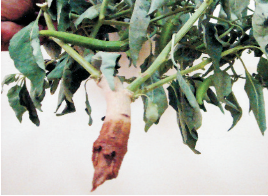
दीमक के प्रकोप से ग्रसित मिर्च का पौधा