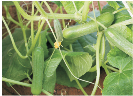
खीरे की बेल पर लगे फल

विकास अवरुद्ध हो जाता है। अधिक आर्द्रता और बादल रहने से कीट एवं रोग की समस्या काफी बढ़ जाती है। पश्चिमी राजस्थान में इसकी खेती गर्मी तथा वर्षा दोनों मौसम में की जाती है। वर्षाकालीन फसल में पौधों की वृद्धि के साथ फलन अधिक होता है।