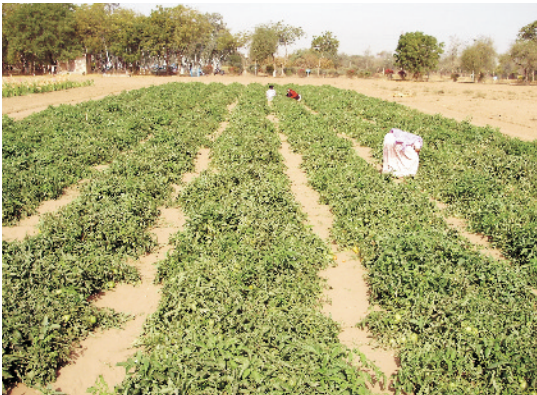
खेत में लगी हुई टमाटर की फसल

सामान्य किस्मों हेतु पौधों की रोपाई के 3-4 सप्ताह पूर्व 20-25 टन गोबर की पूर्णतया सड़ी हुई खाद खेत में डाल कर भली-भाँति मिट्टी में मिला देना चाहिए। इसके अतिरिक्त पौध रोपाई से पूर्व 60 कि.ग्रा. नत्रजन, 80 कि.ग्रा. फॉस्फोरस एवं 60 कि.ग्रा. पोटाश प्रति हेक्टेयर के हिसाब से खेत की अंतिम तैयारी से समय देना चाहिए। पौधे रोपण के 30 व 45 दिन बाद 30-30 कि.ग्रा. नत्रजन की मात्रा खड़ी फसल में देकर सिंचाई कर देना चाहिए।