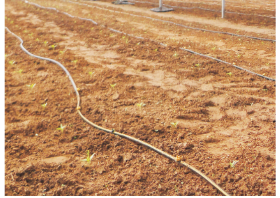
कतारों में सब्जी बीज की रोपाई

हिलाएं ताकि दवा बीज के चारों तरफ अच्छी प्रकार चिपक जाय। कुछ सब्जियाँ जैसे टिंडा, करेला, तरबूज इत्यादि में छिलके कठोर होते हैं जिनकी बुआई 12-24 घंटे तक पानी में भिगोकर सुखाने के पश्चात् ही बोना चाहिए।