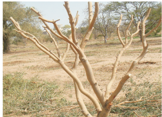
कटाई-छंटाई किया हुआ खेजड़ी का पेड़

पेबन्दी पेड़ों की परम्परागत छंगाई नवम्बर-दिसम्बर में की जा सकती है लेकिन ऐसा करने पर उन्हें अगले साल लूंग