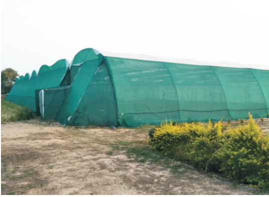
सब्जी उत्पादन हेतु शेडनेट हाउस

पॉलीहाउस की भांति छायादार जाली घर किसी ढांचे पर खड़ी संरचना है। ढांचा लोहे, बांस, लकड़ी आदि का बनाया जा सकता है। इसका आकार इसकी उपयोगिता पर निर्भर करता है। जाली की सघनता इसके इस्तेमाल पर निर्भर करती है। आमतौर पर 50 प्रतिशत तक प्रकाश को रोकने वाली जाली सब्जी उत्पादन के लिए उपयुक्त होती है। यह सूर्य की किरणों की तेजी (प्रकाश) को रोककर अंदर गर्मी को कम करने में सहायक होती है जिससे बाहर की अपेक्षा 4-6 डिग्री सेन्टीग्रेड तापक्रम कम हो जाता है। इसके अंदर फौगर तथा ड्रिप सिंचाई व्यवस्था कर गर्मियों में नर्सरी पौध व सब्जी उत्पादन आसानी से किया जा सकता है। यह वायु तथा ओले के प्रकोप को भी कम करती है।