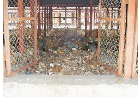
बिना पृथक किये हुए शहरी कचरे से खाद बनाना

शहरों के जैविक अपशिष्ट (रसोई का कचरा, सब्जी मण्डी का कचरा एवं भोजनालय/होटल का कचरा) को गोबर के साथ सड़ाकर एक अच्छी खाद बनाई जा सकती है। इसके लिए ढेर विधि सबसे लाभदायक होती है क्योंकि इससे हानिकारक जीवाणु समाप्त हो जाते हैं। साथ ही इस प्रकार बनी खाद के उपयोग करने से कचरे के निष्पादन के लिए अधिक भूमि की आवश्यकता नहीं पड़ती है। जैविक अपशिष्टों को पृथक करके बनाई गई खाद में भारी धातुओं की मात्रा बहुत कम होती है तथा खाद के गुणों में आशातीत वृद्धि होती है। अतः इस खाद का उपयोग फसल उत्पादन में किया जा सकता है।