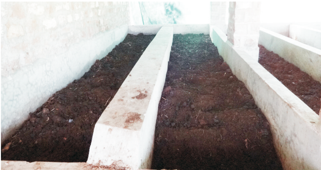
पिट में तैयार हो रही कम्पोस्ट

कम्पोस्टिंग या सड़न की आसान प्रक्रिया को जानकर किसान स्वयं अपने परंपरागत गड्डे से कम समय में उत्तम गुणों वाली खाद बना सकता है, जिसमें जीवांश और पोषक तत्व भरपूर मात्रा में होते हैं।