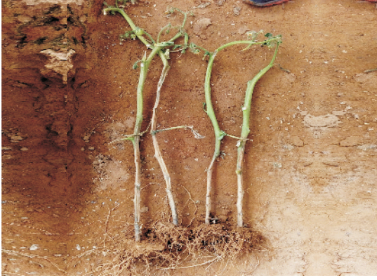
उकठा रोग से ग्रसित टमाटर का पौधा

नियंत्रण : नियंत्रण के लिए फसल चक्र अपनाना चाहिए। 7.5 ग्राम थायोफनेट मिथाइल + 7.5 ग्राम रीडोमिल प्रति 15 लीटर पानी के साथ मिलाकर छिड़काव करना चाहिए।